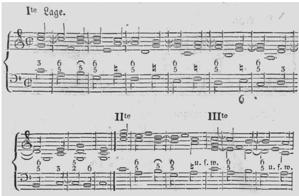
ABBILDUNG 4 Sequenzmodell »Wenn der Baß um eine Terz herabgeht, und dann um einen Ton oder eine Stufe steigt« bei Joseph Drechsler: Theoretisch-praktischer Leitfaden , S. 41 f.

matisierter Version auch dem oben diskutierten Ausschnitt aus der ersten Variation von WoO 79 zugrunde – was heißt, dass der Ton vor dem Sekundschrift jeweils so erhöht ist, dass der Bass immer eine kleine Sekunde ansteigt und so als eingeschobener Leitton zum folgenden Ton angesehen werden kann.